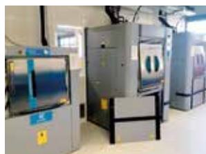
Machines ateliers blanchisserie