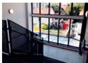
Baies vitrées sur cour