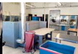
Espaces de travail ateliers blanchisserie