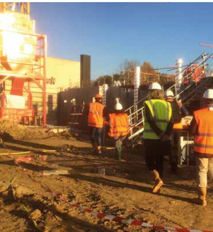
Chantier de Rosebrie